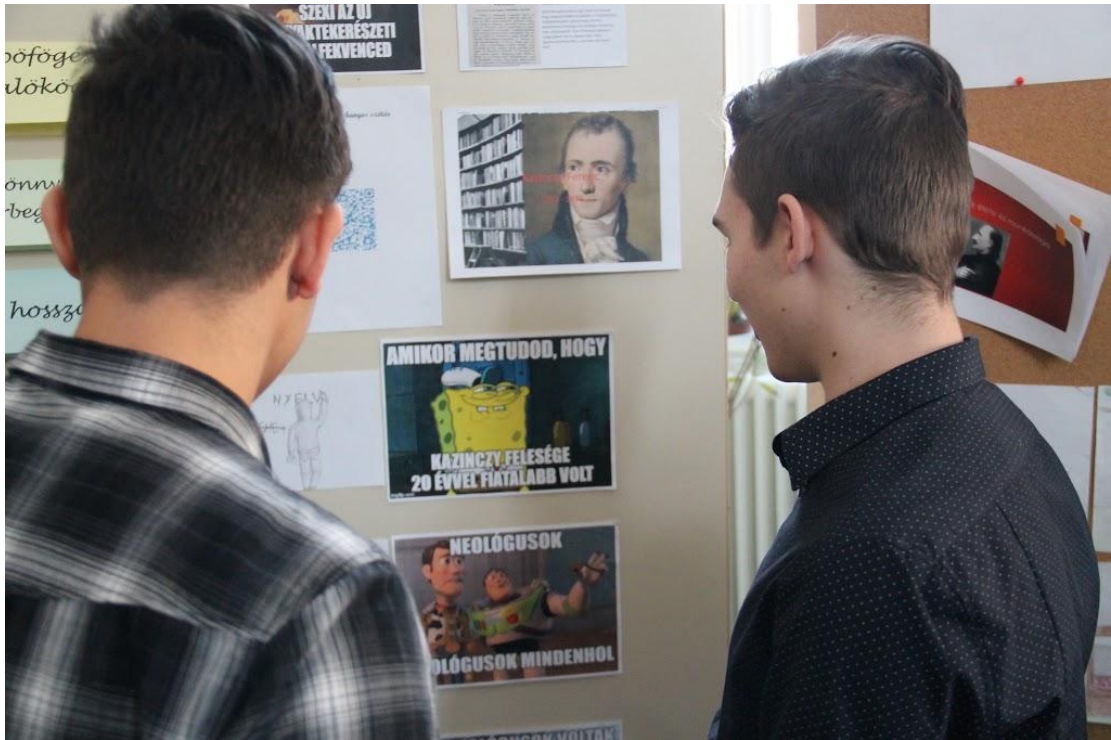
Remekművekből idén sem volt hiány