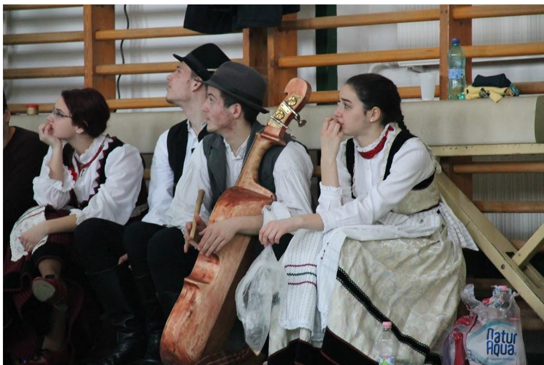
A kiállítás megnyitója után magyar néptáncot tanulhattak az érdeklődők iskolánk hagyományőrzeitől