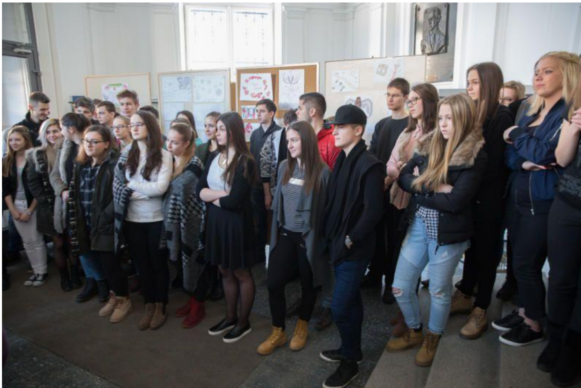
A múzeum megvalósítói, a 10. C és az érdeklődő diákok

Hogy igazán jó munkát végezhesenek a tanulók, a Debreceni Irodalmi Múzeumba is ellátogattunk, sőt a témazáró dolgozat előtt egy saját készítésű társasjátékkal rendszerezzük tudásunkat és tesszük próbára magunkat, mennyire vagyunk "felvilágosultak"!